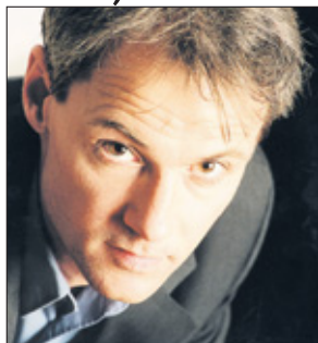
SP-Kamerlid Harry van Bommel.

Het echte probleem is tweeledig. Om te beginnen is er de herintroductie van de Amerikaanse vierde vloot in de Caribi-